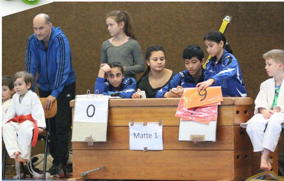
Den Anfang machten die Mädchen, bei denen 40 Teilnehmerinnen am Start waren.

Kinder aus 25 Wiesbadener und Mainzer Grundschulen nahmen an unserem ersten Vereinsrandori 2016 im Februar teil.